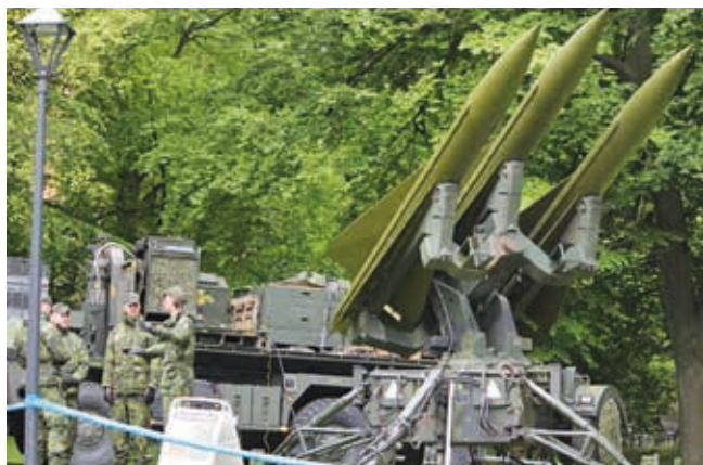
RBS 97 grupperat i Norre Katts Park.

FMTS (Försvarsmaktens Tekniska Skola) hade detta år huvudansvaret för planeringen av genomförandet. Försvarsmakten hade tilldelats Norre Katts Park som sitt område för att visa upp sin verksamhet.