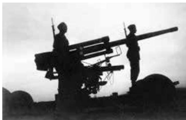
Luftvärnssoldater på post i december 1943 med 7,5 cm lvpjäs m/37 i höjderna vid nuvarande vattentornet i Ystad.

1937 stod detta fältpostnummer för Landstormsförband inom Södra militärområdet, Malmöhus södra inskrivningsområde, I 107, III bataljonsstaben, 10 kompaniet.