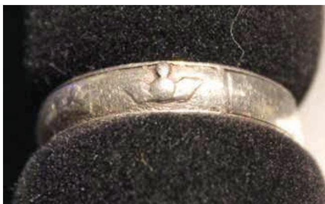
Min morfars kamratering från militärtjänstgöringen.

Min morfar hade under sin tjänstgöring anskaffat en kamratering i silver. På ringen fanns det infanteritecknen, luftvärnstecken, en krona samt länkar. Dessutom fanns det en inskription KS. Ringen låg bland min mors smycken och jag var tvungen att få den omgjord genom att ta bort en bit eftersom min morfar hade betydligt kraftigare fingrar. Jag har burit ringen i ca 5 år och tyvärr har den blivit så sliten att samtliga tecken är på väg att försvinna. Men jag hoppas att den bringar mig tur så jag fortsätter att använda den så får vi se hur länge den förblir användbar.