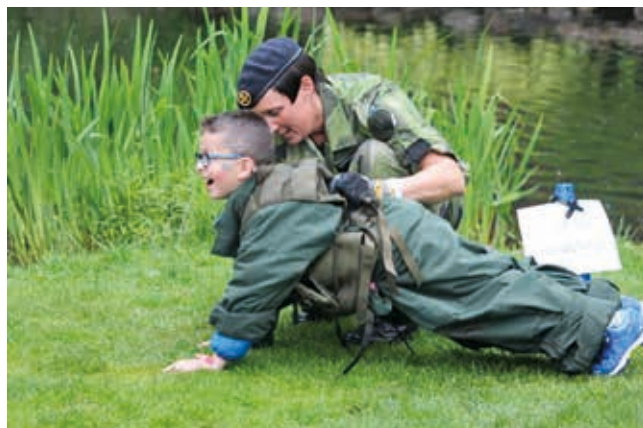
En ung besökare prövar utrustning och gör armhävningar.

Soldatens dag genomfördes tillsammans med andra aktiviteter i Halmstad denna dag. Hela arrangementet gick under namnet Halmstadgillet. Utställningar, hantverk, marknader, kulturevenemang och Pridefestival. I Pridefestival deltog också Försvarsmakten för att visa var vi står när det gäller alla människors lika värde. Oavsett kön, sexuell läggning, religion eller hudfärg skall alla känna sig välkomna till Försvarsmakten.