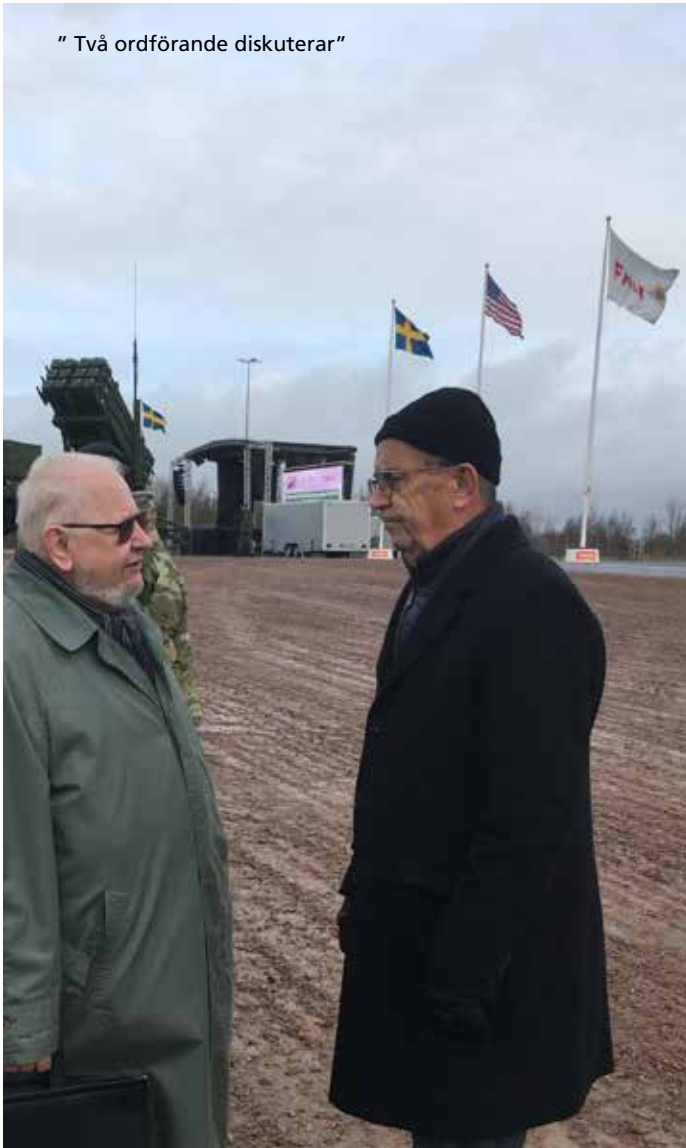
” Två ordförande diskuterar ”