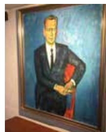
Generalsekreterare Dag Hammarskjöld

FN:s generalförsamling antog den 10 december 1948 en allmän förklaring om de mänskliga rättigheterna. Förklaringen definierar vilka de grundläggande mänskliga rättigheterna är och togs fram av den dåvarande kommissionen för mänskliga rättigheter under ledning av Eleanor Roosevelt.