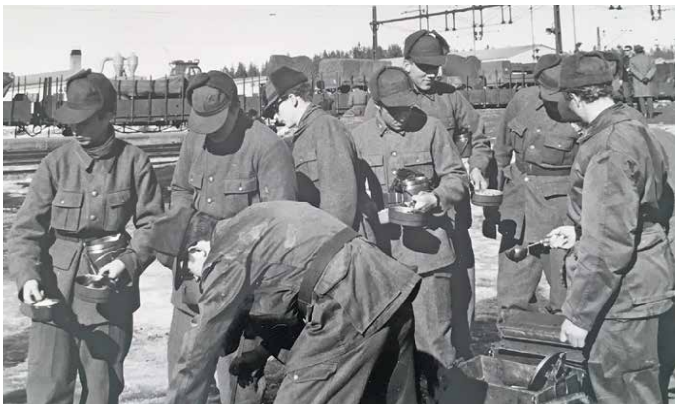
Utpisning på resan från Malmö till Älvsbyn