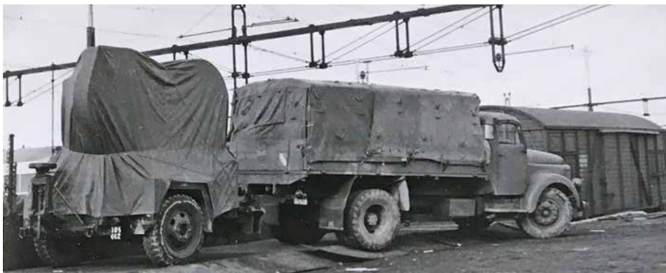
Belysningsradar framme i Älvsbyn blir avlastad

Testet fungerade till stor belåtenhet. Materielen fungerade. Våra värnpliktiga kunde på ett riktigt sätt bemanna och betjäna denna nya utrustning.