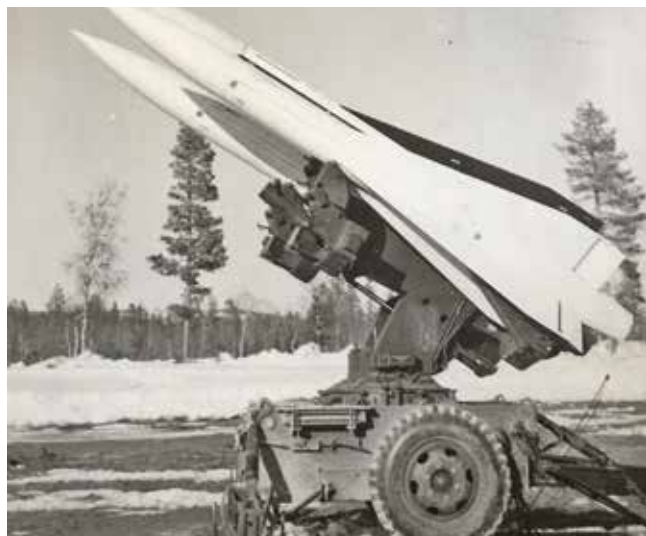
Lavetten med robotar startklar Vidsel