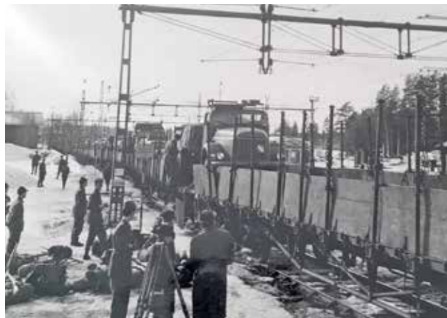
Avlastning förbereds i Älvsbyn

Veckorna före skjutningen genomfördes kontroller och tester av materielen och den 14 april var det dags för det första robotskottet.